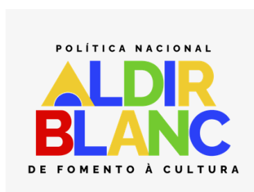
EXEMPLO APLICAÇÃO EM BOX BRANCO

3.4 A aplicação do logo deve ser feita, prioritariamente, sobre fundo branco.